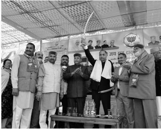
Paonta Block in Nahan Vidhan Sabha area and rupees one crore for various developmental works in Municipal Council area of Nahan.

Earlier, the Chief Minister inaugurated Rs. 9.95 crore upgradation of road from Banog to Kheri, Rs. 1.90 crore upgradation of Kheri to Meerpur Gurudwara, Rs. 3.92 crore upgradation of road from Bohlion to Sambhalika, Rs. 2.13 crore District Treasury building at Nahan,